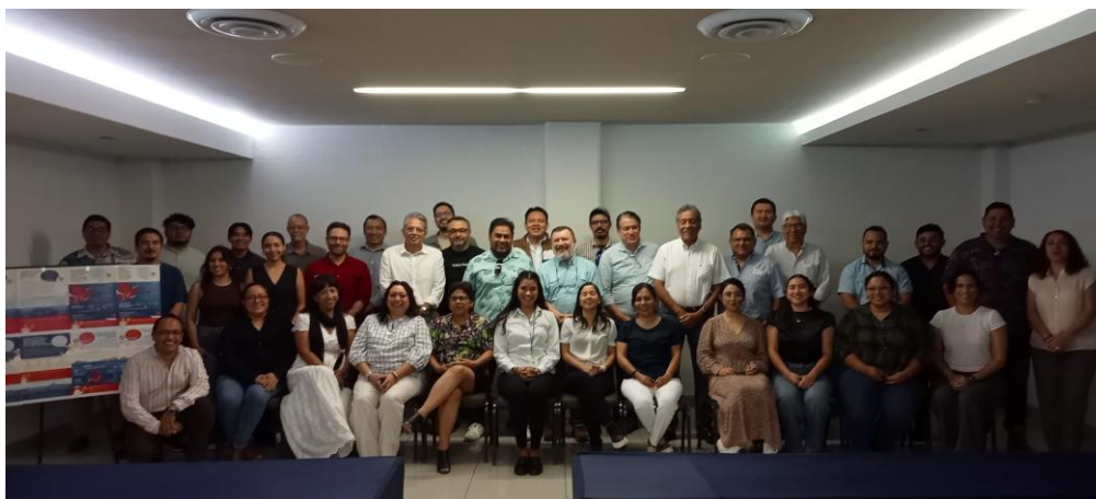
Figura 1. Foto de los asistentes presenciales del taller

Se elaboró la propuesta de boletín para RRSS de IMIPAS y dar a conocer el trabajo realizado con los academicos de la Región IV de la RNIIPA.