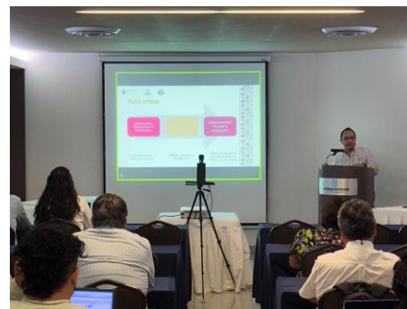
Figura 3. Presentación de los resultados de los talleres con el sector y la dinámica de las actividades.