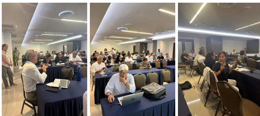
Figura 4. Desarrollo del taller y participación de los asistentes