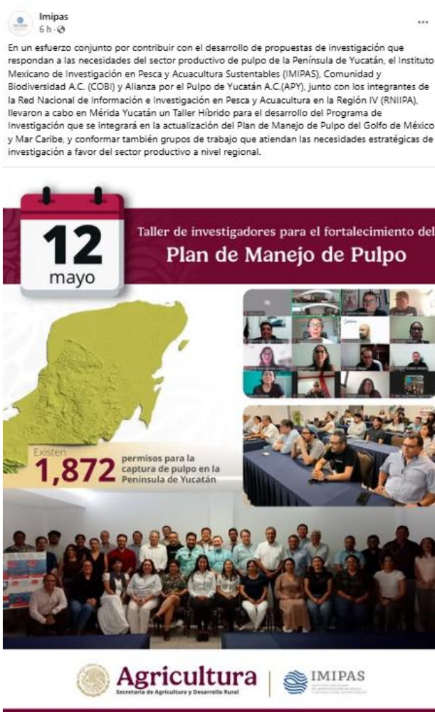
Figura 5. Boletín del taller publicado en RRSS de IMIPAS