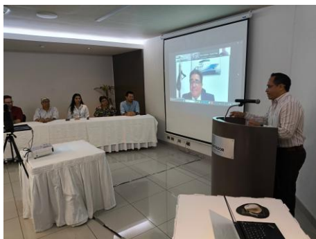
Figura 3. Imagen del presídium durante el mensaje del Director del Atlántico de manera virtual.