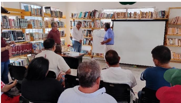
Figura 1. Proceso participativo de la reunión de productores de tilapia en estanques de nivel freático.

Se realizó un recorrido por algunas granjas para conocer las condiciones generales de los estanques, estableciéndose al final una ruta de trabajo para obtener los prebióticos, información básica de los estanques, análisis de sedimentos y desarrollo de propuestas para posible obtención de financiamiento de la draga requerida para los trabajos de desasolve.