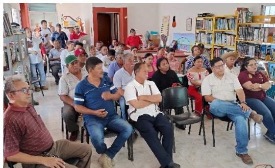
Figura 2. Perspectiva de la asistencia del taller.