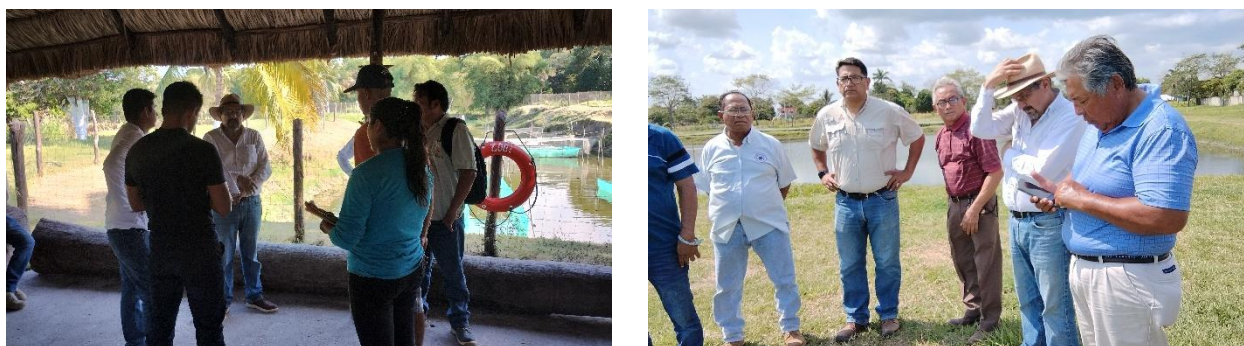
Figura 3. Imágenes del recorrido a las granjas para conocer el estado de los estanques de nivel freático de los productores interesados en el programa de saneamiento.