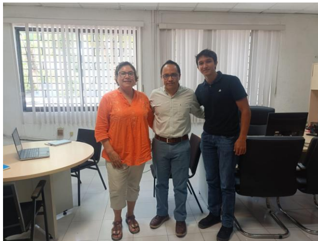
Figura 1. Investigadora de UNACAR y Estudiante de la Facultad de Biología que asistieron presencialmente a la Reunión del Proyecto Cherna.