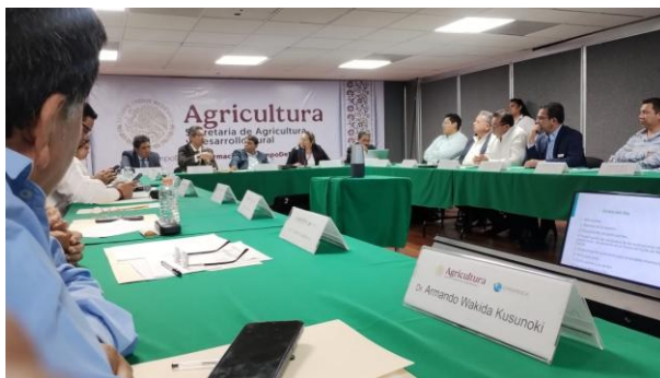
Figura 3. Perspectiva de la reunión de veda con el sector.