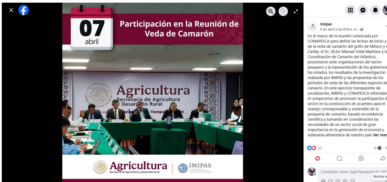
Figura 4. Nota elaborada para RRSS de IMIPAS