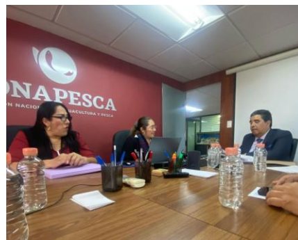
Figura 2. Reunión previa con la Dirección de General de Ordenamiento Pesquero y Acuicola.