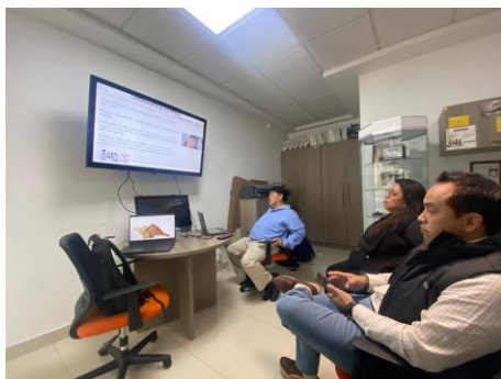
Figura 1. Reunión interna para revisión de presentación y elaboración de portafolio de riesgos

Finalmente se asistio a la reunión de veda con los representantes del sector pesquero de Camarón del Golfo de México, donde se apoyo a CONAPESCA levantando notas de la reunión para la minuta; realizando también la nota informativa para redes sociales de IMIPAS.