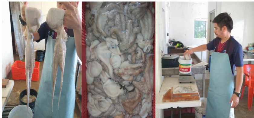
Figura 4. Registro de biometrías de pulpo maya de las capturas realizadas por pescadores en los puertos de San Felipe, El Cuyo y Rio Lagartos, durante la temporada de pulpo 2025.