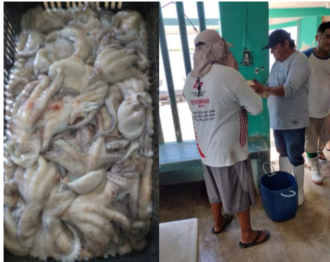
Figura 3. Aplicación de entrevistas a pescadores durante la temporada de pulpo 2025, en los puertos de San Felipe, El Cuyo y Rio Lagartos.