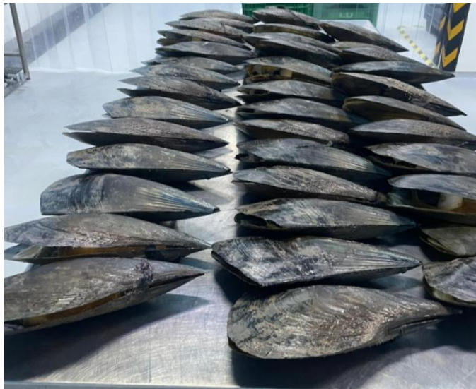
Figura 2. Muestra de callos de hacha recolectados en los polígonos solicitados para permisos de pesca comercial para la medición de datos biométricos

Sin otro particular, quedó a sus órdenes para la aclaración de cualquier duda que pueda surgir,