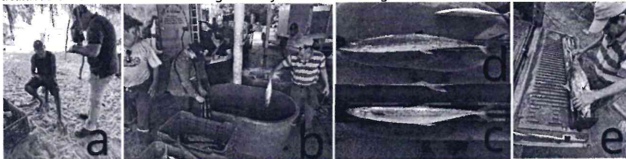
Fig. a) entrevistas a pescadores, Fig. b) muestreo biológico de la captura de las embarcaciones, Fig. c) sierra, Fig. d) peto, Fig. e) bonito.

La información recopilada consistió en el registro en el apoyo al proyecto de GOM, se realizaron 38 entrevistas de rendimiento y esfuerzo de pesca ( Fig. a ), del muestreo biológico de la captura de las embarcaciones menores ( Fig. b ) con un total de: 229 sierras ( Fig. c ), 453 peto ( Fig. d ), 3 bala, 101 huachinango, 2 cazón pala, 2 lenwini 6 dorado, 22 bonito ( Fig. e ), 9 cojinuda, 1 pez vela, 2 barracuda, 15 bacalao. De los cuales se obtuvieron gónadas y otolitos de 14 organismos.