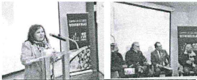
ENSENADA.- Se realizó el XV Taller de las Conchas y el Vino Nuevo, bajo la coordinación de Provino.

ESTE VIERNES SE REALIZÓ EL ENCUENTRO EN LAS INSTALACIONES DEL CETYS UNIVERSIDAD CON CONFERENCIAS MAGISTRALES Y MESAS TEMÁTICAS DE EXPERTOS Y PRODUCTORES