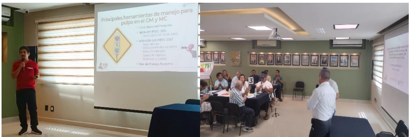
Figura 1. Participación en una breve exposición para el tercer taller sobre la actualización del plan de manejo de pulpo, en la Cd. de Campeche, el 24 de abril de 2024.