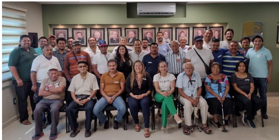
Figura 3. Foto grupal de todos los participantes del tercer taller sobre la actualización del plan de manejo de pulpo, en la Cd. de San F. de Campeche, en las instalaciones del Consejo Coordinador Empresarial de Campeche.