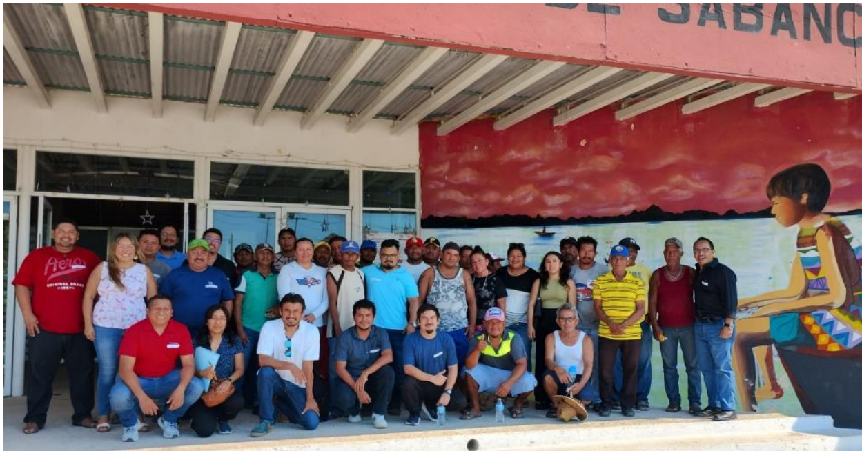
Figura 6. Foto grupal de todos los participantes del puerto taller sobre la actualización del plan de manejo de pulpo, en el puerto de Sabancuy, Campeche, en las instalaciones del ayuntamiento de Sabancuy.