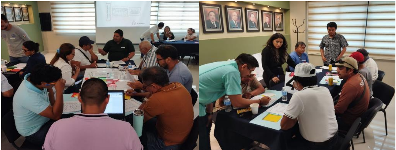
Figura 2. Actividad realizada durante el tercer taller para la actualización del plan de manejo de pulpo, para la priorización de acciones de manejo.

Durante el cuarto taller en el Puerto de Sabancuy, solo se contó con la participación del FIP de pulpo en Yucatán. El 25 de abril de 2024 en el puerto de Sabancuy se contó con la participación de 22 personas del sector pesquero, de las cuales, 18 fueron hombres y 4 mujeres. Cabe mencionar que esta ocasión no se contó con la participación de alguna autoridad. Por lo anterior dichos talleres ayudaran en la priorización de las acciones para la actualización del plan de manejo, así como retroalimentación de los talleres previos realizados en Campeche, por parte de los compañeros del CRIAP-Lerma, Campeche.