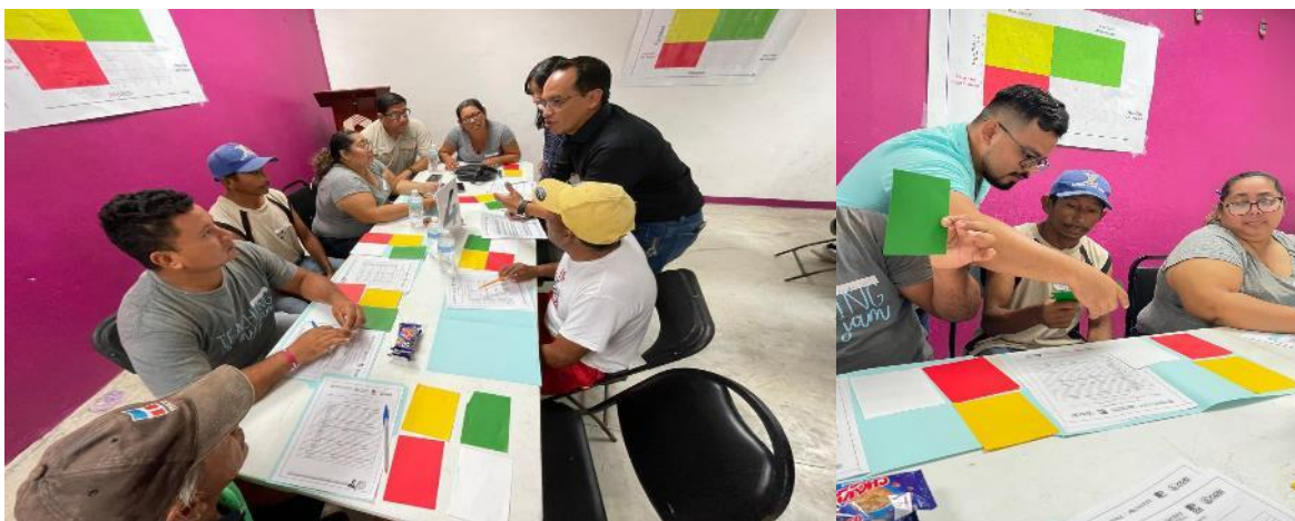
Figura 5. Participación en la actividad realizada durante el cuarto taller para la actualización del plan de manejo de pulpo, para la priorización de acciones de manejo, tomando en cuenta la opinión de pescadores en el puerto de Sabancuy.