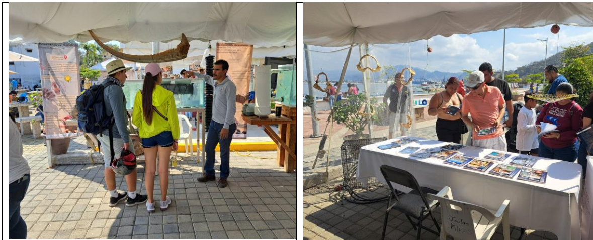
Figura 6. A) Jefe de CRIAP Manzanillo dando información acerca de la investigación realizada en el IMIPAS. B) Pescadores deportivos adquiriendo la revista Ciencia Pesquera realizada por el IMIPAS.