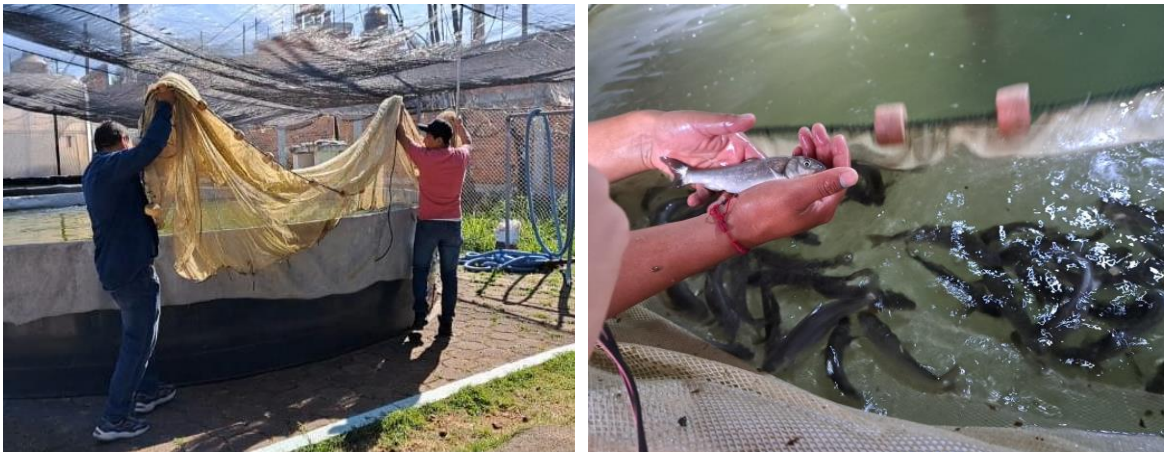
Figura 1. Proyecto de pescado Acúmara y pescado blanco. A) Uso de redes para la obtención de juveniles de acúmara. B) Extracción de reproductores de pescado blanco. Nota. Además de las fotos se cuenta con video para difusión.