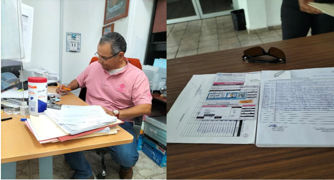
Diapositiva 1. Oficinas de catastro municipal y estación biológica.