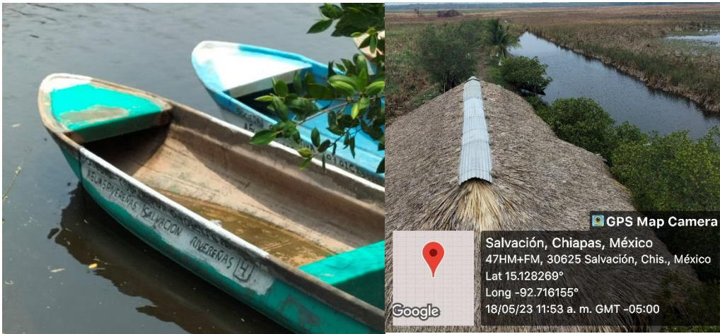
Diapositiva 2. Visita a la comunidad del Escobo, en la Salvación