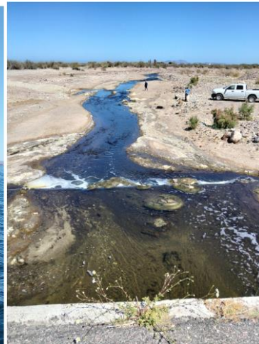
Descarga de mina de fosforita