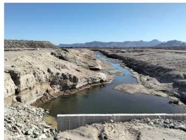
Descarga granja camaronera