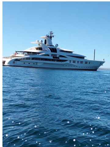
Canal de Navegación