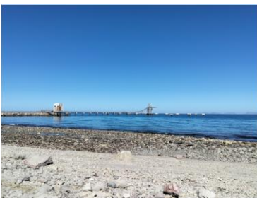
Embarque de mineral