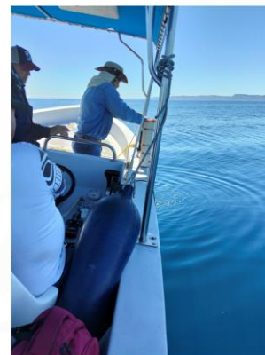
Toma muestras de agua