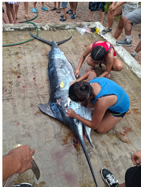
Evidencia de la comisión del torneo Internacional de pesca deportiva en Barra de Navidad