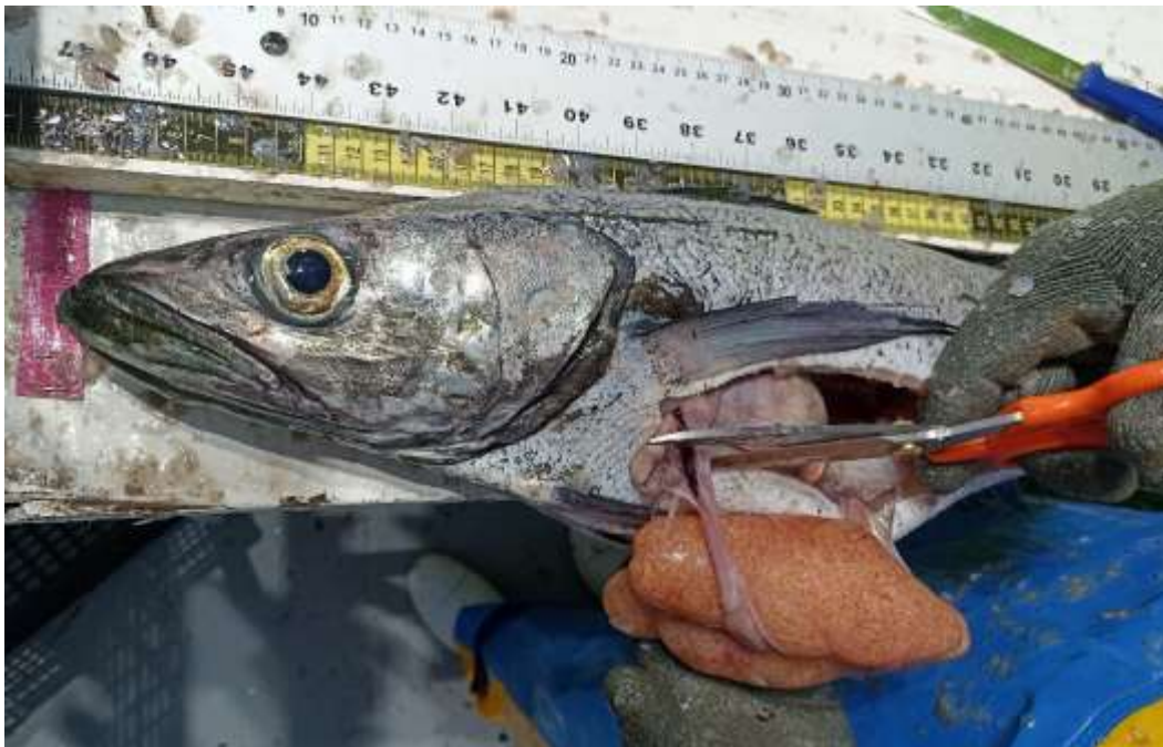
Figura 2. Muestreo biológico de merluza del Pacífico ( Merluccius productus ), tomadas durante los muestreos de las descargas de la flota merluquera.