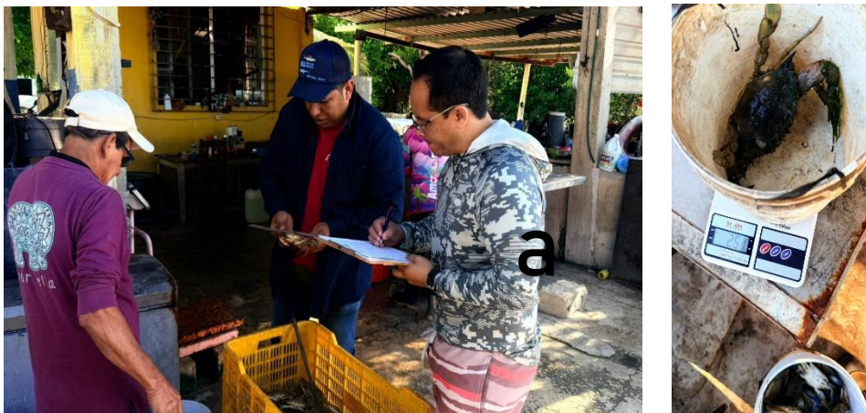
Fig. a) muestreo biológico de la captura de las embarcaciones

La información recopilada consistió en el registro del esfuerzo pesquero, la captura, zonas y gastos de la pesca. En total se realizaron 14 entrevistas (Fig.a) de jaiba en dos localidades isla aguada y palo alto y planta de sabancuy. La información biológica consistió en el registro de 647 jaibas ( C. sapidus ) obteniendo LT, SEXO, PESO Y MADUREZ, jaiba prieta 5 organismos, jaiba pata seca 28 organismos, y jaibones 47 organismos.